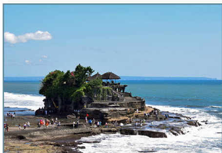
Bali, il tempio Tanah Lot