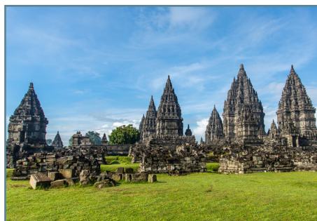
Yogyakarta, il tempio di Prambanan